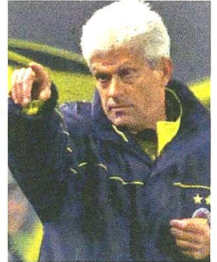
Wird wohl nicht LASK-Trainer: Weltenbummler Lorant.

wurde – nicht sein. Laut Insidern steht der ehe- malige VfB Stuttgart-Profi Zvonimir Soldo bei den Schwarz-Weißen hoch im Kurs. Der 41-jährige Kroa- te hatte 2008 mit Dinamo Zagreb das Double geholt, trat anschließend aber zu- rück. Laut Reichel gibt es Kandidaten aus dem In- und Ausland. Eine öster- reichische Lösung könnte Ex-Altach-Coach Georg Zellhofer sein. (hof)